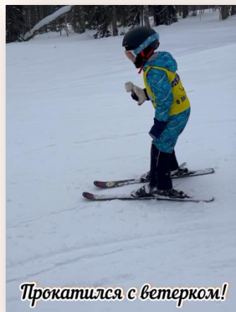
Прокатился с ветерком!